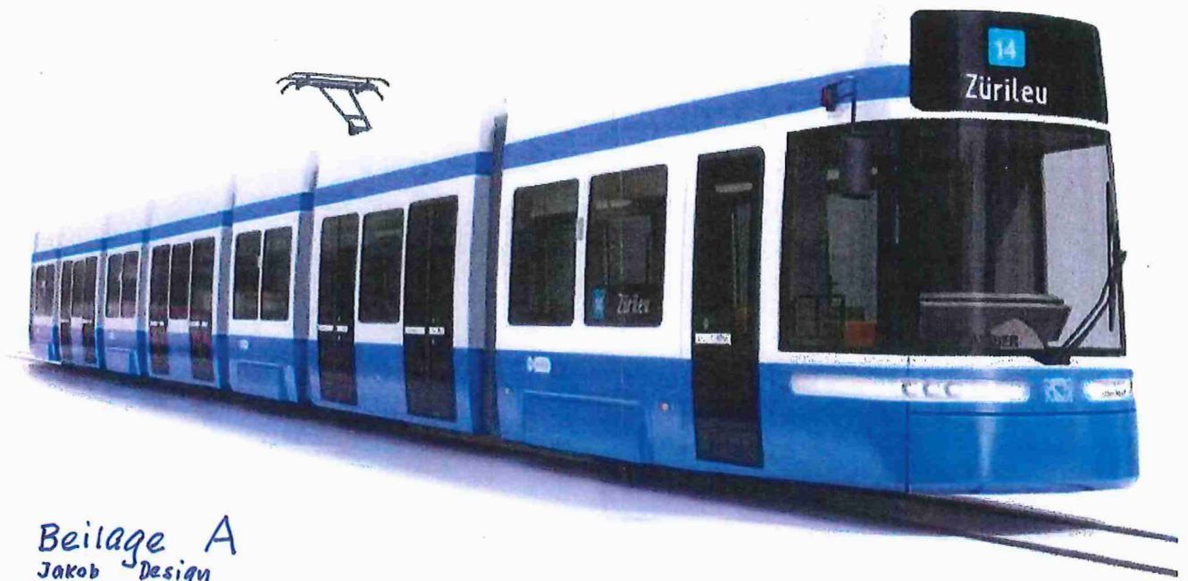
Beilage A Jakob Design