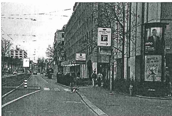
Abb. 5: Badenerstrasse 414