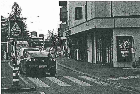
Abb. 3: Badenerstrasse 647