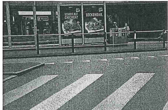
Abb. 4: Albisriederplatz