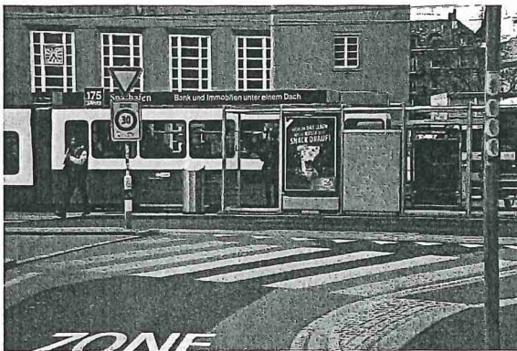
Abb. 1: Bahnhof Wiedikon